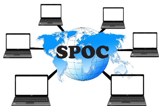
SPOC (Small Private Online Course)