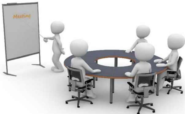
Formation en présentiel